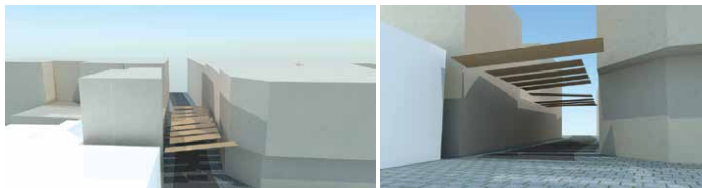
Simulación toldos calle Santísimo