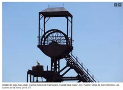
Centrale del pacco San Jabbán. Cuernica Subterra del Puroblanco, Ciudad Real. Autor: JCC. Fuente: Atlas de Sierra Morena. LIS. Colección de la Tierra, 2013 (3)