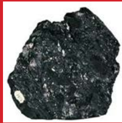
PATRIMONIO MINERO E INDUSTRIAL